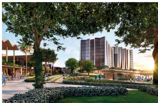
效果图-可能会有所改变

每栋建筑都将与The Lanes的未来零售区域相连，如底楼零售商圈和办公楼宇；居民设施包括游泳池和露台，休息区，桑拿浴室，水疗中心和健身房。居民还将享受丰富的绿化区域，包括公共室外绿地。