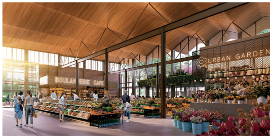
效果图-可能会有所改变