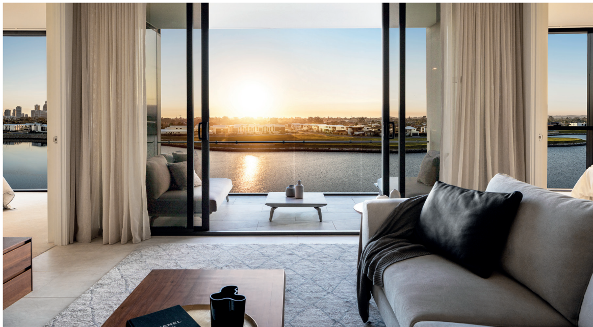
效果图-可能会有所改变

SUNLAND 集团很高兴向您隆重推出THE LANES RESIDENCES - 西城 (WEST VILLAGE) - 两栋反映第一阶段的精品湖滨公寓楼，将领先建筑设计、零售和便利设施结合在一起，打造终极生活方式目的地。